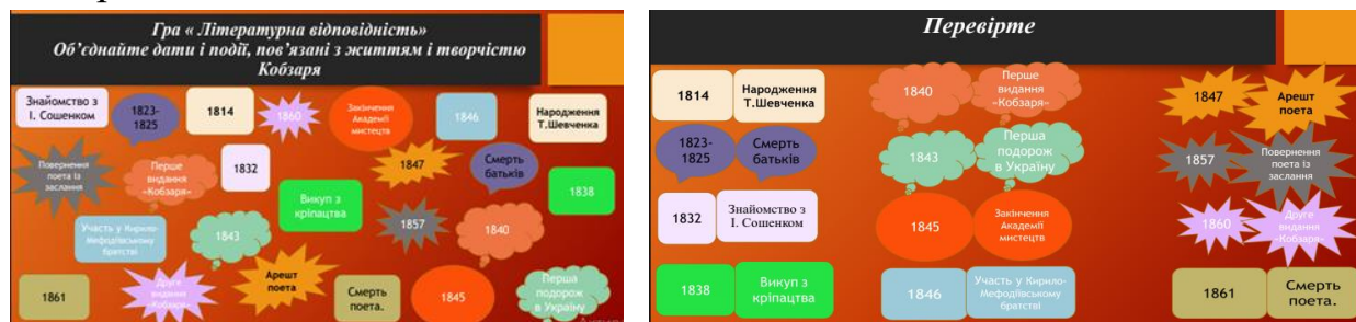
Рисунок 5. Об'єднання запропонованих тем.

Інтерактивна гра на встановлення відповідностей між літературними творами, історичними датами, математичними зображеннями. Нестандартні підходи до проведення етапу закріплення матеріалу допомагає активізувати зацікавленість учнів, обдарованим надає підґрунтя створити свої проекти удосконаленого прочитання й закріплення вивченої теми із залученням сучасних програм. Встановлення відповідностей розвиває асоціативна мислення й міжпредметні зв'язки.