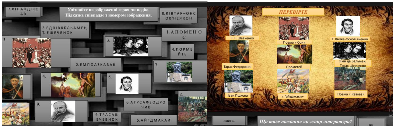
Рисунок 4. Герой та подія.

Інтерактивність та залученість: ігровий формат підвищує мотивацію та активність на уроці.