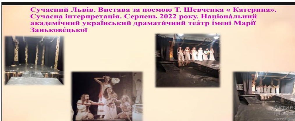
Рисунок 7. Сучна інтерпретація поеми.

Мистецький контекст дозволяє обдарованим учням яскраво візуалізувати актуальність літературної спадщини, перетворює урок літератури на простір для творчого діалогу між епохами, культурами та формами мистецтва.