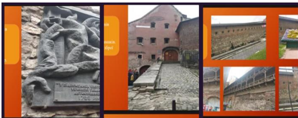
Рис. 3.

Використання автентичних фото історичних місць допомагає учням візуалізувати події, описані в літературних творах, поглиблює розуміння контексту епохи Коліївщини.