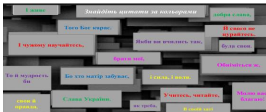
Рис.8. Робота з цитатами.

Кольористика в літературі: завдання розвиває увагу до художніх деталей та розуміння символіки кольору в літературному творі. Асоціативне мислення: учні встановлюють зв'язки між кольоровими образами та емоційним наповненням тексту. Креативна інтерпретація: пошук цитат за кольорами стимулює нестандартне прочитання класичних творів.